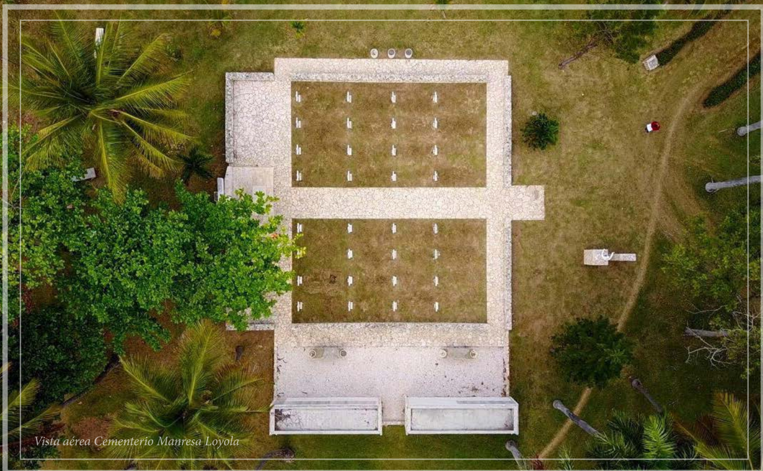
Vista aérea Cementerio Manresa Loyola

Cuba, Rep. Dominicana, Miami | Noviembre, 2017 · www.antsj.org